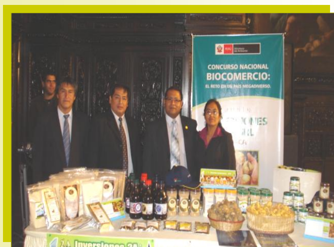
Asociados Inversiones 2A, obtuvo el Segundo Lugar en el Concurso Nacional Biocomercio: El Reto en Un país Megadiverso

El Concurso Nacional de Biocomercio identificó valiosas experiencias ligadas a la maca, granos andinos procesados, hierbas aromáticas, quinua, tara y aguaje. Otros participantes utilizaron productos como sachá inchi, miel de abeja ecológica, granadilla, muña, oca, camarones, carne y lana de camélidos, tawa -fruto que crece en la Amazonía-. Hubo, también, emprendimientos referidos a artesanía para exportación, productos envasados y bebidas derivados del aguaymanto y sanky (cactus aya-